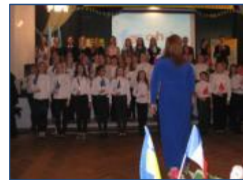
Chorale de l'école qui interprète des chansons françaises.