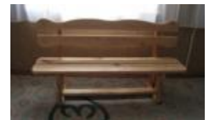
Un banc fabriqué par les élèves.