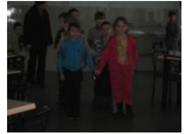
Les élèves rentrent au réfectoire pour prendre leur petit-déjeuner.