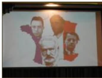
A vous de reconnaître les célébrités françaises présentes à l'écran.