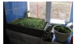
Les semis pour les futurs massifs