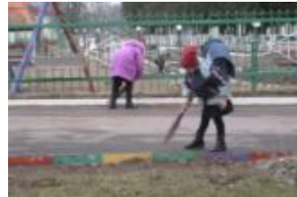
Chaque classe à tour de rôle est responsable de la propreté de la cour.