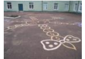
Un jeu tracé dans la cour.