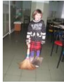
Une élève balaie le réfectoire.