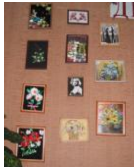
Les travaux des élèves primés dans les concours régionaux sont affichés dans le hall.