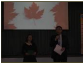
M. Roman Waschuk, ambassadeur du Canada

Et c'est ainsi que nous avons assisté au spectacle de l'école en compagnie des ambassadeurs de France, du Canada et des attachés culturels de la Belgique, du Luxembourg et du Maroc. Très beau spectacle clôturé par une photo de tous les participants suivie d'une dégustation des plats nationaux de chaque pays, cuisinés par les élèves et leurs professeurs.